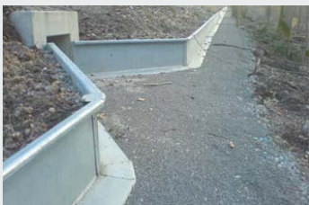
Stahl / Steel

We also supply permanent installations made of steel and concrete, with all accessories such as tunnels, stop drains and equipment for catching and counting of populations.