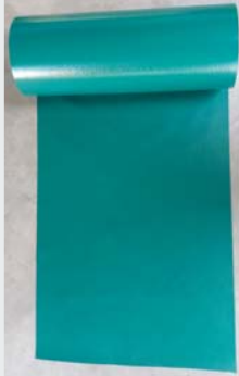
Gewebefolie Polyester foil