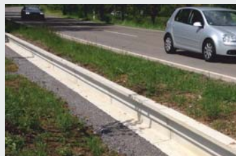
Beton / Concrete Sondervariante Laubfrosch-/Molchtauglich Special version proof for salamander and tree frog