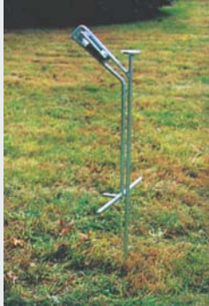
Haltepfosten, feuerverzinkt Support post, galvanized