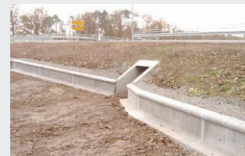
Beton / Concrete Standard