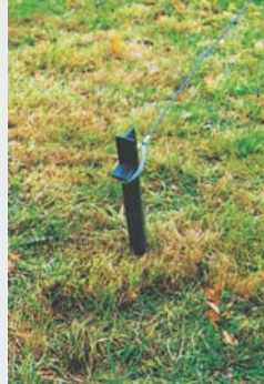
Hering und Seil peg and rope